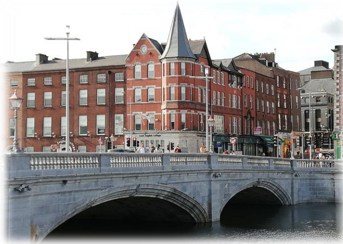
Budova školy CEC, kde prebiehal kurz.

Toto leto 2019 som sa prostredníctvom erasmového programu zúčastnila zdokonaľovacieho kurzu pre učiteľov angličtiny, v Írskom mestečku Cork.