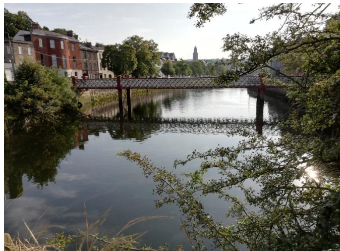
Cestou do školy ma denne sprevádzali krásne výhľady.

Od školy som bývala pešo 40 minút, čo bolo zväčša veľmi príjemné, obzvlášť ráno po ceste do školy. Samozrejme ma občas pokúšalo typické írske počasie, ktoré sa striedalo každých pár minút ako teplo, zima, dusno, vlhko, dážď, slnko a takto stále dokola.